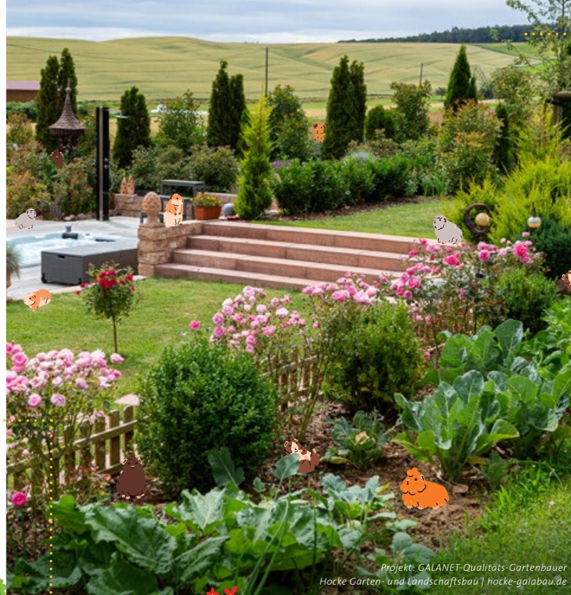
Projekt: GALANET-Qualitäts-Gartenbauer Hocke Garten- und Landschaftsbau | hocke-galabau.de