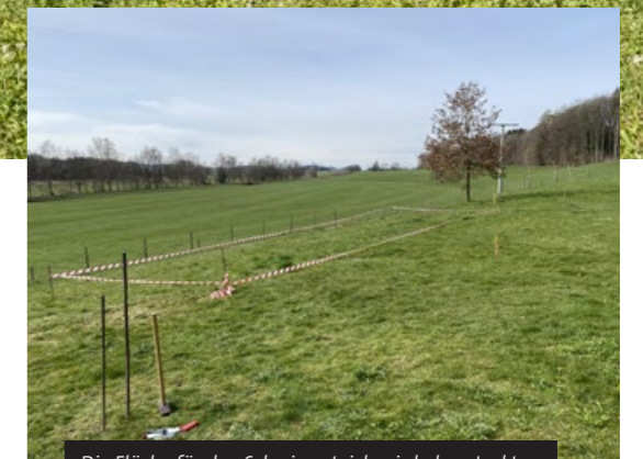
Die Fläche für den Schwimmteich wird abgesteckt – hier nimmt die Planung Gestalt an.