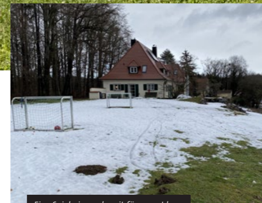
Eine Spielwiese – bereit für neue Ideen.

Ein Garten in einzigartiger Lage: Am Waldrand, auf einer Hangkante mit weitem Blick über Wiesen, Bach und Berge, liegt das 8000 m 2 große Grundstück. Eine Familie mit Kindern wünschte sich hier eine naturnahe Ergänzung zum bereits vorhandenen Garten – ein Schwimmteich, der zum Spielen, Entspannen und Genießen einlädt.